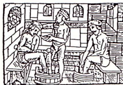
Abbildung 54: Badestube, Holzschnitt, Strassburg, 1547.

Exempel på bilder som analyseras i avhandlingen. (Den högra bilden stöder tesen att under medeltiden uppfattades inte närvaron av tjänstefolk som besvärande ens i den äktenskapliga sängkammaren. Den högra bilden ska stöda tesen att det normalt gick anständigt till i medeltidens badhus. Medeltida badscener med män och kvinnor är hämtade från förtäckta glädjehus och inte från reguljära badhus hävdar författaren.)