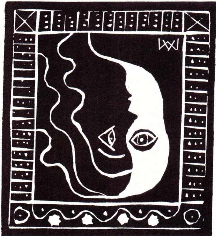
Linoletttryck av Matti Multanen