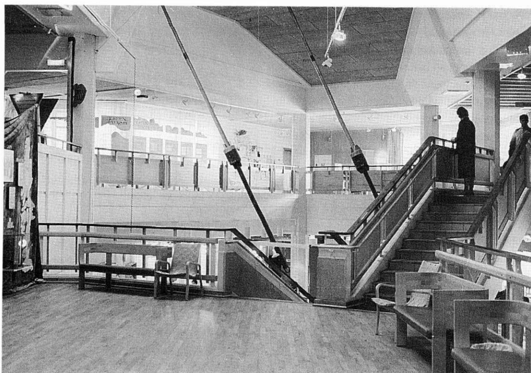
Interiör från Bohuslänns museum 1991.

seets "fyra väggar". Byggnaden är belägen på en central plats i Uddevalla utan direkt anknäring till stadens gatunät vid en ganska ödslig trafikplats med ett resecentrum, en parkeringsplats, en å och ett hotell som närmsta grannar. Platsen där museet ligger har stor betydelse, berättade museiledningen. Alldeles nära museibygnaden kan båtar angöra och museet kan vända sig mot vattnet vid olika evenemang, som exempelvis bryggdansen.