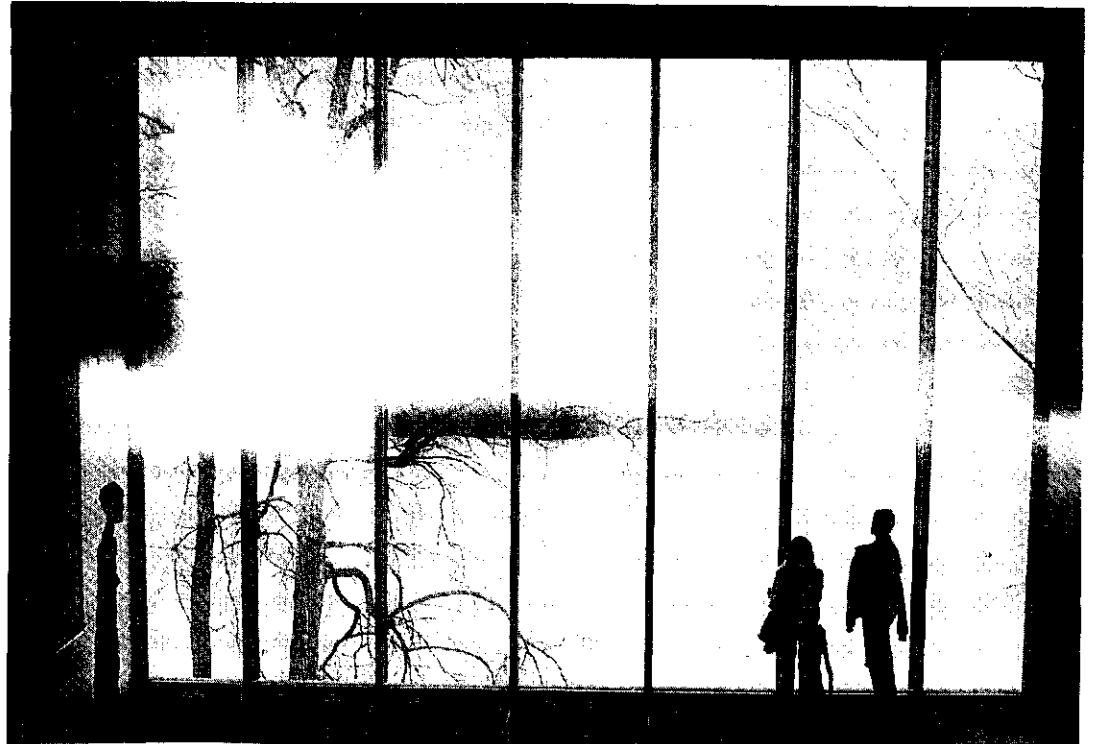
Interiör från Louisiana, Humlebæk, 1991.

söder om Helsingør. Detta museum har, liksom Bohusläns museum, en mängd olika aktiviteter, såsom föredrag, konserter, teaterföreställningar och barnprogram. Till Louisiana kommer cirka 500 000 människor varje år. (Rubin, 1992.)