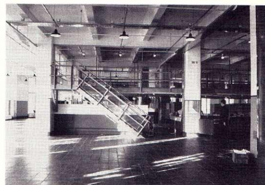
Interiör från Arbetets museum "Strykjärnet", 1992.

Placeringen av museet i Norrköping i ett äldre industrilandskap är ett medvetet val från stiftelsebildarna och museiledningen. Norrköping har långa anor som industristad och en stark förankring i arbetarrörelsen. Det centralt placerade industrilandskapet utgör ett dominant inslag i Norrköpings stadsmiljö. En mångfacet-