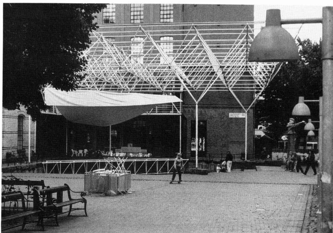
Amfiscenen i Brandts Klædefabrik i Odense, 1990.

På Louisiana drivs arbetet som en offentlig självvägande institution. Både byggnaderna och samlingarna ägs av museet, som lyder under ett kungligt dekret. En fond har upprättats med namnet Louisiana-Fonden som samlar in medel för verksamheten. Både fonden och institutionen administreras av samma styrelse. Louisiana ger ut en tidskrift, Louisiana Revy , som kommer ut med tre nummer om året och ofta fungerar som katalog till utställningarna. Louisiana-klubben har startats för att stimulera museets kulturella aktiviteter och för att knyta till sig en större krets av speciellt intresserade människor till museet. Klubben har cirka 45 000 medlemmar. ( Louisiana ... 1992. )