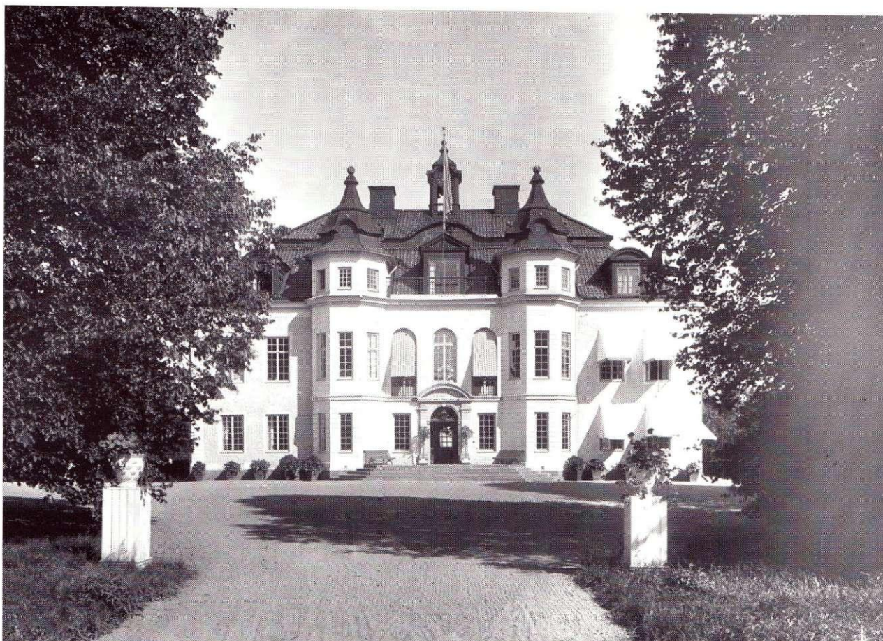
Björnsnäs efter I G Clasons restaurering 1898.

Vidare ritningarnas uppläggning, skalor, detaljutformning och beskrivningstexter. Här är även organisationen inom Clasons arkitektkontor av intresse. Detta bestod av cirka tio medarbetare varav några trotjänare som höll i samordningen av projekteringen och ett antal yngre ofta mycket talangfulla arkitekter som deltog i utformningsarbetet. Vid de stora herrgårdsrestaureringarna var huvudbyggnaden endast en viktig delfråga. Även trädgård och park med trädgårdsbyggnader som lusthus, orangeri och badhus omfattades av projekten. I dessa frågor tog Clason hjälp av trädgårdsarkitekter inom kontoret eller i fritt men långsiktigt samarbete med fristående konsulter. En viktig sådan var Rudolf Abelin. Vidare gjordes moderna bostäder för gårdens anställda och ekonomibyggnader för lantbrukets drift. Allt detta samordnades i de mest omfattande restaureringsprojekten till en välfungerande estetisk och praktisk helhet.