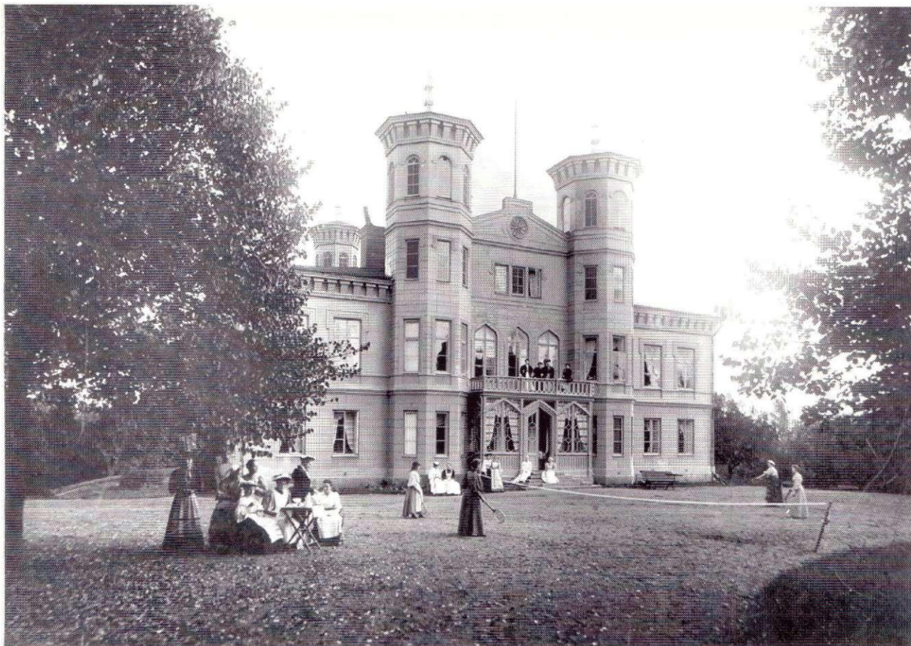
Björnsnäs nära Norrköping uppförd 1859 efter ritning av arkitekt Knut Forsberg (1829–95).

andet mellan restaurering och nybyggande. Där kan även vissa projekt där Clasons roll ej kunnat fastställas redovisas.