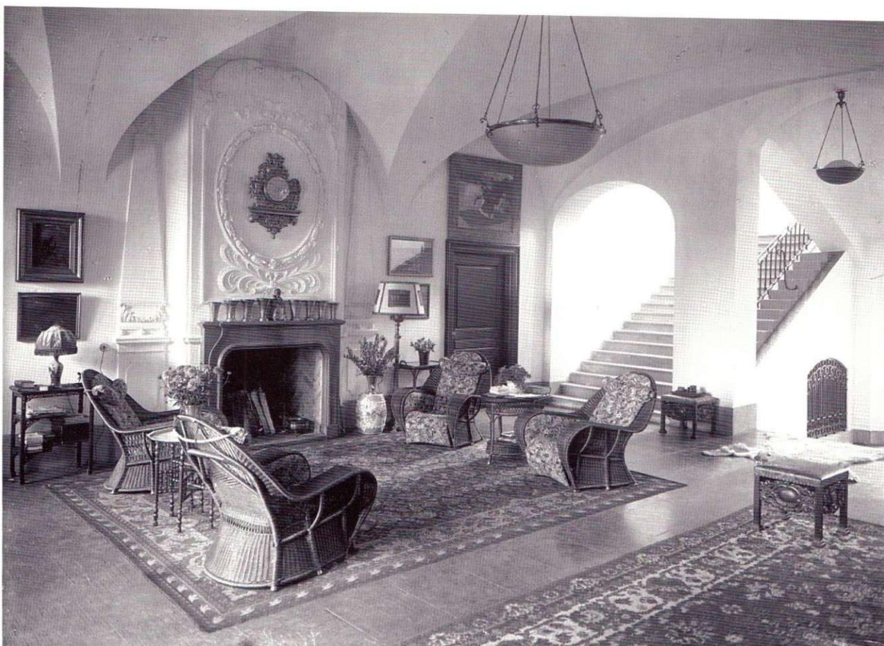
Hallen i Stegeborgs herrgård som Clason omvandlade till ett ombonat sällskapsrum vid restaureringen 1915.

nadstraditionen som sin viktigaste inspirationskälla. I denna fas av arbetet används konstvetenskapliga metoder som bildanalys liksom studier av den vid tiden rådande restaureringsideologin och dess praktiska tillämpning.