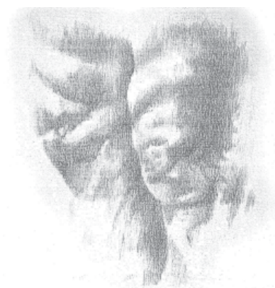
Studie av knän, 30 x 30 cm, silverstift på preparerad träplatta, tecknat av Erin Pedersen.

Min avhandlings tentativa titel är Att få et språk för erfarenheten. En konstfacklig undersökning av några historiska och nutida aspekter av aktteckning . Avhandlingen har som sin utgångspunkt en undersökning av didaktiska frågeställningar om teckning efter modell (aktteckning). Det är två målsättningar som varit viktiga och den ena har varit att få ett bredare kontextuellt perspektiv på den nutida aktteckningen/aktundervisningen. Dette har möjliggjorts genom att historiskt ”gå upp” i aktteckningens didaktiska spår, genom att analysera akten diskursivt ur ett könsperspektiv och genom