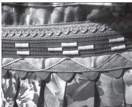
Detalj av dekor på inuitisk klesplagg

Prosjektet "Improvisation within a Tradition. The Vernacular Design Process of Contemporary Inupiaq Clothing" er en case-studie av hvordan inuitiske (eskimoiske) kvinner fra landsbyen Kaktovik i Nord-Alaska tenker og handler når de designer og lager klær, i en moderne, levende tradisjon. Undersøkelsene i Alaska ble gjennomført ved hjelp av observasjon av designprosessen når klærne ble laget, samt intervjuer, alt filmet med digital video. For å få en dypere forståelse designet og sydde jeg også sjøl, med utgangspunkt i deres tradisjon. Dekoren på klærne er spesielt fokusert. På bomullstoff med organiske mønstre i mange farger komponerer de dekor i geometriske mønstre, ved å sette sammen bånd i ulike farger til en intrikat dekor. Teknikken er helt unik for dette