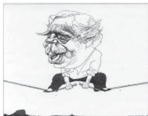
Finn Graff: Vaclav Havel

Som tegnepedagog savnet jeg kunnskap om hvordan man kan formulere seg med tegning isteden for med ord når man har en bestemt sak på hjertet. Noen avistegnere har lært seg et distinkt bildespråk til menings- og idéformidling. Jeg undersøker et slikt bildespråkssystem gjennom Finn Graffs og Saul Steinbergs tegninger hvor betydninger bygges med metaforer. Problemstillingen i dr.avhandlingen Visuell retorikk og fortellerteknikk i metaforbasert tegning er følgende: Finnes det en metaforbasert måte å tegne på og hva kjennetegner den? I problemstillingen inngår både hva slags bildeelementer som er i anvendelse, hvilke kategorier som finnes og hvordan de kan kombineres. Jeg går ut fra at slike kategorier virker på basis av våre mentale mekanismer. Hvilke mentale mekanismer og strategier for meningsinnhold er i virksomhet? Kognitiv metafor-teori plederer at vår tenkning er grunnleggende metaforisk. Denne teorien er mitt hovedinstrument til å vikle ut de ”klumper” av betydninger som ligger i en tegning som denne, og Graffs formulering av president Havels engang umulige situasjon. Teorigrunnlaget ellers består av retorikk, bildesemiotikk, narratologi, kognitiv lingvistikk og kunst- og bildefaglig viten.