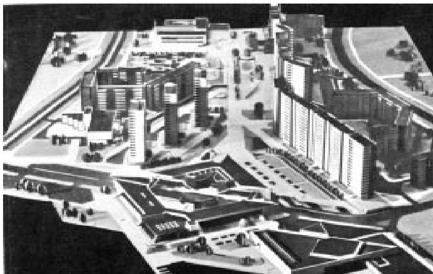
Modellfoto över Mezciems (ur Strautmanis et al., 1987)

Namnet Mezciems betyder skogsby. Denna stadsdel