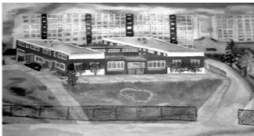
Kristine Popilas (11 år) bild av Mezciems och den lettiska skolan (2000)