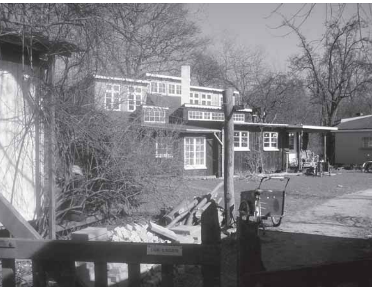
Selvbyggerhus omkring skurvogn, Børneengen

skurvogne. Den geografiske spredningen over området ledsages af en mere permanent og stationær karakter i skurvognsbyggerierne, en udvikling der forstærkes af byggeboomet, som finder sted på Christiania i 80'erne.