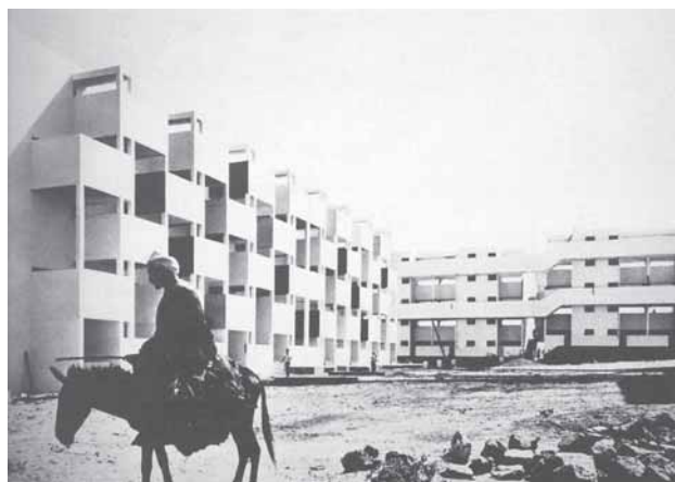
Bebyggelse i Marokko før og efter (1953–1992): de nye hvide facader indtages af beboere med en helt anden rumlig logik.