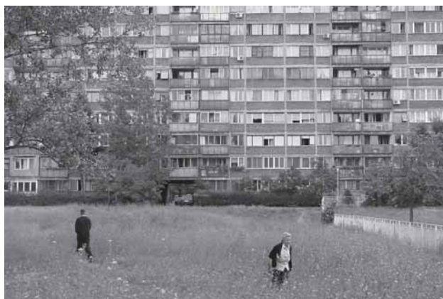
Novi Beograd under konstruktion og i dag.