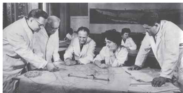
Planlægning i Jugoslavien var en seriøs beskæftigelse....