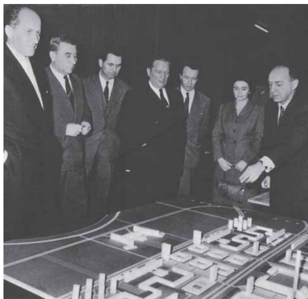
Tito med følge inspicerer modellen af Novi Beograd.

venster-liberal regering, tegnet af en kommunistisk arkitekt, bygget af et udviklingsorienteret styre og indtaget af et bureaukratisk-autoritativt diktatur er kun med til at understrege dette 12 .