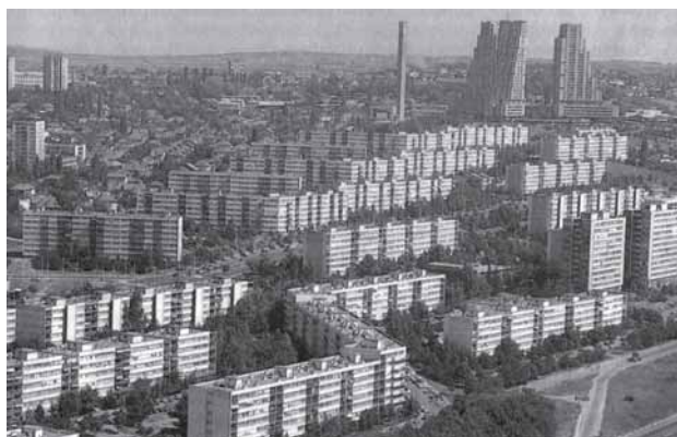
Vue over Novi Beograd

I Titos Jugoslavien blev den modernistiske arkitektur også brugt til at fremme både den politiske overbevisning og det nationale tilhørsforhold. Beograds berømte og berygtede new town, Novi Beograd, hvis grundsten allerede blev lagt i 1947, var et ambitiøst projekt, der udover en enorm skala skulle være et symbol på det 'nye socialistiske menneske' og dennes entusiasme og stærke vilje 13 . Samtidig var Novi Beograd tænkt som en 'rollemodel' for en hel række nye, socialistiske new towns. Novi Beograd var således tænkt som en 'prototype', der kunne kopieres og opføres et hvilket som helst andet sted i Jugoslavien. Det federale arkitektur-