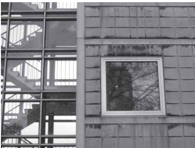
Udsnit fra den danske Velfærdsby i dag: Høje Gladsaxe, Tingbjerg og Bellahøj.

serede arkitektoniske programmer blev denne målsætning faktisk mødt, og bl.a. Stockholms satellitbyer vidner om den hast og iver, hvormed folkhemmet blev opbygget. 'Miljonprogrammet' var, ligesom den danske 'velfærdsby', tæt forbundet med den svenske, socialdemokratiske velfærdsstat, og Folkhemmet og 'Miljonprogrammet' er således på mange måder næsten gået hen og er blevet synonyme.