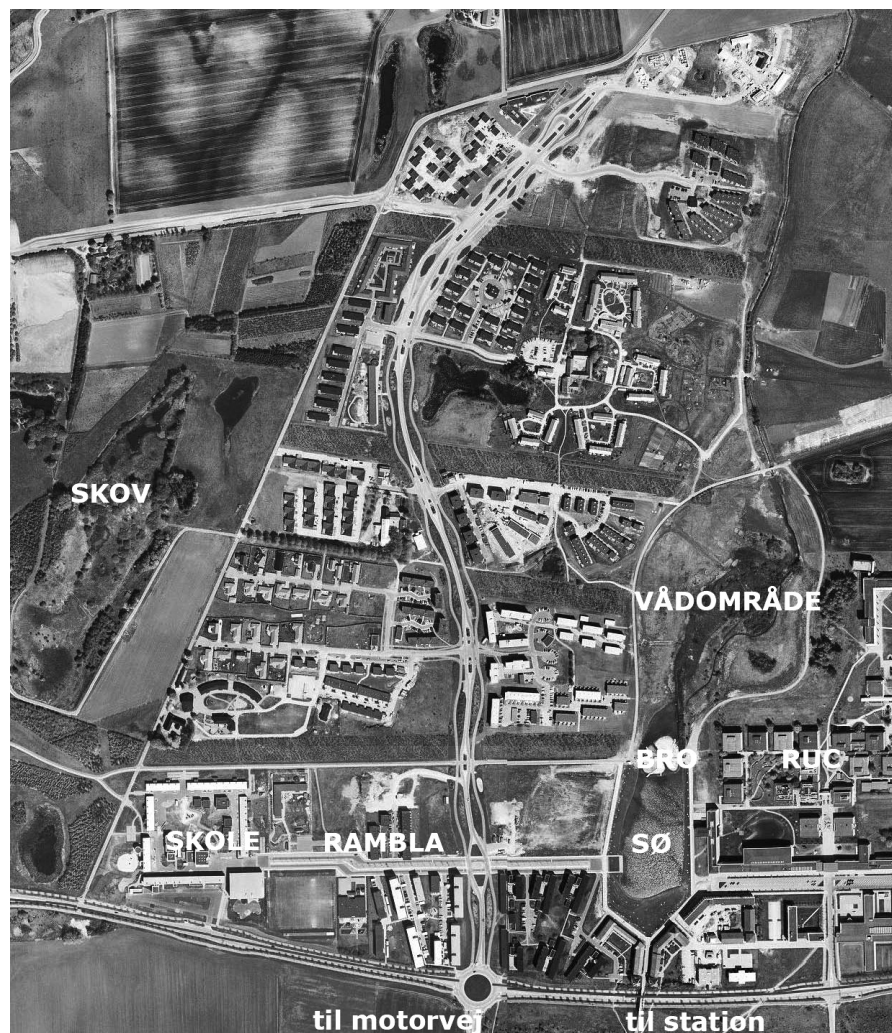
Oversigt over byområdet Trekroner

Masterplanen for Trekroner beskriver ikke bebyggelsen, men definerer arealer i form af storparceller, hvor bebyggelsen kan placeres. Til storparcellerne knyttes anvendelses- og bebyggelsesregulerende bestemmelser, som sigter mod, at der kommer forskellige bygningstyper, varierende tætheder og blandede ejerformer. Det er en pragmatisk løsning, der er sædvane ved planlægning af nye områder til boligformål. Hensigten er at stille Roskilde kommunen, som ejede det store areal, hvor det nye byområde er etableret, bedst muligt ved salg af jorden til bebyggelse. Jo større interessen er for at bygge i området, jo flere betingelser kan kommunen sidenhen stille til de bebyggelsesplaner, der er grundlaget for at afhænde arealet og udstede byggetilladelser. I Trekroner er der gjort en særlig indsats, når storparceller udbydes til salg, idet kommunens teknikere bistår ikke-professionelle bygherrer med at kvalificere deres tilbud, så de bliver i stand til at konkurrere med professionelle byggeselskaber og entreprenører. Denne indsats er led i en strategi om at tiltrække ressourcer-