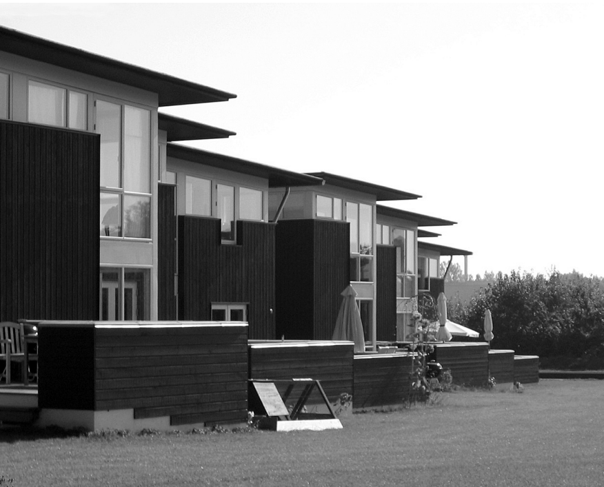
Bofællesskabet Absalons Have

tærke beboere, og det er blandt andet lykkedes at etablere flere bofællesskaber i området.