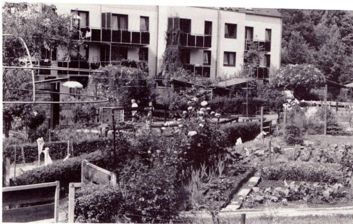
Lägenhetsträdgårdar i modern flerbostadsbebyggelse. Witten-Annen, Tyskland.

duktionskultur. Den "ekologiska" rörelsen är ett uttryck för detta, med ingredienser som lokal produktion, informellt arbete etc. Men produktionskulturen är inte uttryck för något nytänkande i egentlig mening. Från att före industrialismen ha varit den förhärskande kulturformen har den legat under ytan, tills nu, men hela tiden funnits levande och burits upp av stora grupper av befolkningen i deras vardagsliv. Vi kan idag se uttryck för denna kultur t ex i det omfattande självbyggeriet av fritidshus, i kolonirörelsen och fritidsodlingen och i delar av småbåtsrörelsen. De samhällsgrupper som är tongivande inom samhällsplaneringen – högre tjänstemän framför allt – ser emellertid i allmänhet denna kultur som något som är skilt från vardagsverkligheten. Den hör semestern och veckosluten till och man måste fara bort till ett fritidsboställe för att utöva den, vilket de själva gör. Följden har blivit att alla de stadsbor som bor i lägenhet och saknar fritidshus i stort sett berövats möjligheten att