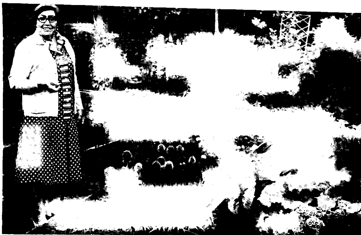
Varför kan inte marken i flerbostadsområden få se ut så här? Varför måste detta förvisas till särskilda odlingslottsområden? Bergsjön, Göteborg.

mådde stå emot den linjära konsumtionskulturens planeringsprinciper ens i Tyskland, trots de briljanta exempel på lösningar med lägenhetsträdgårdar som gjordes där av bl a arkitekterna Ernst May och Bruno Taut i samarbete med trädgårdsarkitekten Leberecht Migge visar på styrkeförhållandena mellan dessa båda kulturer. Har de ändrats tillräckligt idag för att det ska vara