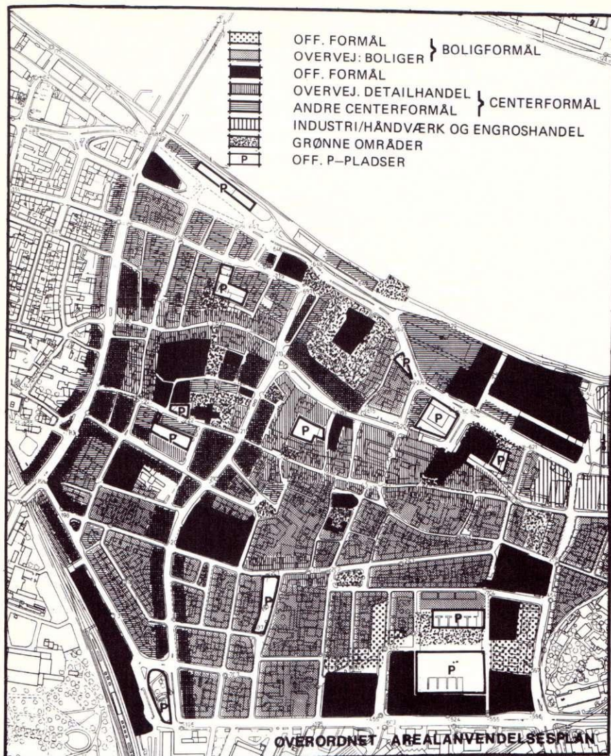
Markanvändningsplan för Ålborgs stadskärna 1979 (s. 89, bd II).

fentlig sektor tvingas laborera med tekniska och politiska argument, medan de senare kan mobilisera väsentligt större resurser och bedriva propaganda på helt andra, och ofta effektivare sätt. Flyvbjerg tangerar denna fråga, men fullföljer inte diskussionen.