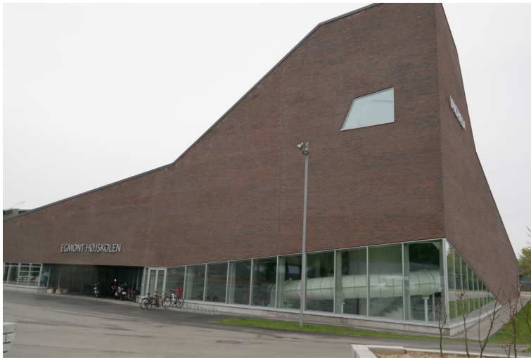
Figur 1 Ankomsten til bygningen