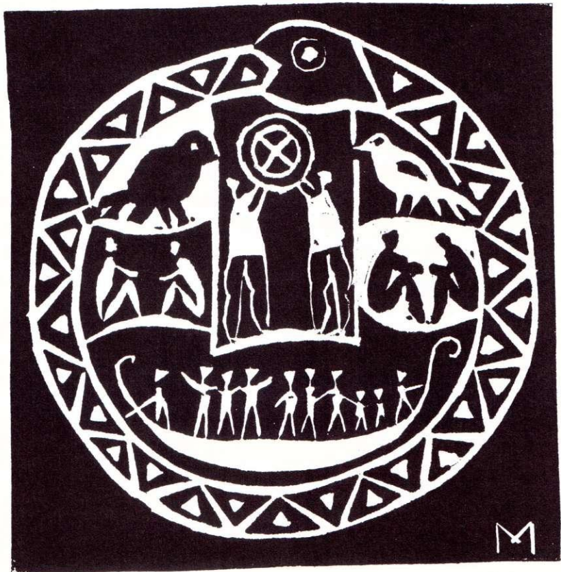
Linoleumtryck av Matti Multanen