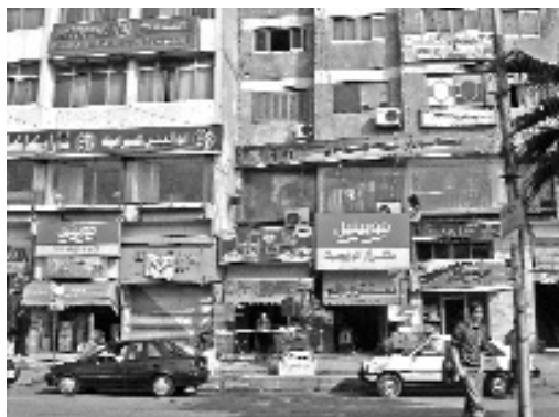
Lag på lag - skilte i det centrale bycenter.

Vernakulære kunstformer som graffiti og vægmalerier danner nye lag oven på de monokrome modernistiske bygninger, mens gated communities, nye boligkomplekser og individuelle huse i mere klassisk arabisk stil bliver bygget på tomme grunde og manifesterer en kulturel og økonomisk diversitet. I boligområderne er der blevet foretaget en mængde tilpasninger i og omkring lejlighederne. Døre og vinduer er blevet erstattet, altaner er blevet omformet og malet, facader dekoreret, små semiprivete haver etableret foran ejendommene, kiosker og caféer er blevet opført og indrettet, lejligheder i stueetagen er blevet lavet om til butikker, og moskéer bliver bygget. Boligkvarterernes mindre centre og især det større hovedcenter er blevet transformeret til bazarer. Den moderne arkitektur er her helt indkapslet af plakattav-