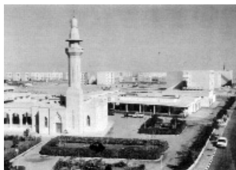
T.v.: Konstruktion af byen T.h.: Første færdige communitycenter i Tenth of Ramadan City.

Alligevel fremhæver nogle af de tidlige beboere glæde over byens eksisterende indretninger, plads og parker, som i sammenligning med Kairo dog fungerede bedre. 12 Folk i Kairo, der havde råd, købte i 1980'erne lejligheder i Tenth of Ramadan City og brugte dem som ferielejligheder. At få af byens beboere ifølge en undersøgelse i 1990'erne var analfabeter, til sammenligning med næsten 40% nationalt,