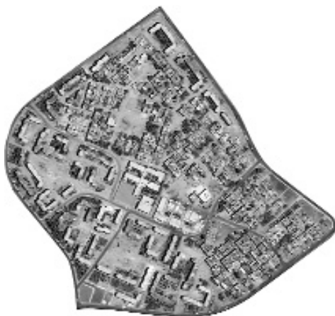
Det 14. kvarter.