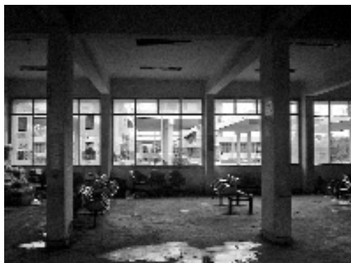
Den centrale busstation.

den centrale busstation med de elegante søjler i international stil til at se nedslidt og vandaleret ud. New Town-idealet om orden og fællesskab i det offentlige rum går tabt i den måde, hvorpå samtidens urbane kultur og sociale organisation udspiller sig på byens overflade. Samtidig gives byen imidlertid et indhold, blot i en anden form. Receptionen af det urbane rum har produceret en mangfoldighed af subkulturelle aktiviteter og funktionsændringer.