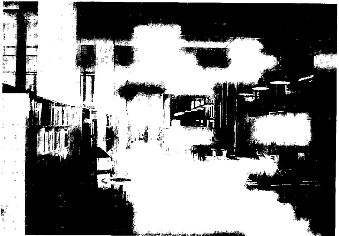
Bibliotek omgivet av arbetslokaler för Arbetsmuseum i Norrköping.

att oförenliga ställningstaganden kunnat hållas för vetenskapligt acceptabla, medan olika försök att förena dessa inom ett tänkesätt ansetts som omöjliga.