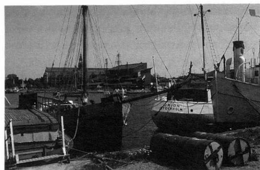
T. v. Globen en snålblåsigt dag. T. h. Skeppsholmens kaj bakom Moderna museets nybygge. Skall arkitekturen lägga livet till rätta? Eller livet arkitekturen?

den okunskap som hittintills präglat den normativa diskursen.