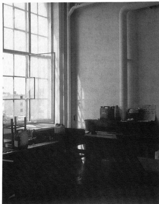
Grafikverkstad i Fyns Konstakademi på Brandts klædefabrik i Odense.

uttryck. I betydelsen gemenskapsriter har gemensamma kulturinstitutioner alltid funnits, men offentliga kulturella inrättningar i modern mening är något annat. De har mer specifikt fått sin karaktär av de feodala hovens representativa kultur.