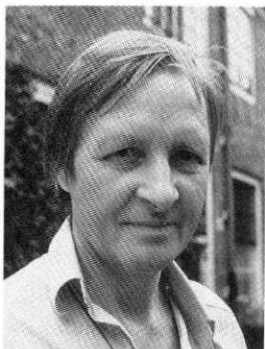
Bernhard Waldenfels, Ruhr-Universität Bochum, Tyskland

Artikeln är ett illustrativt exempel på den fenomenologiska metoden att genom observationer, iakttagelser och reflexioner nå en vidgad insikt, i detta fallet om vår syn på, vårt förhållande till och vårt varande i landskapet. Den har tidigare varit publicerad som "Gänge durch die Landschaft" i In den Netzen der Lebenswelt (Suhrkamp, Frankfurt am Main 1985).