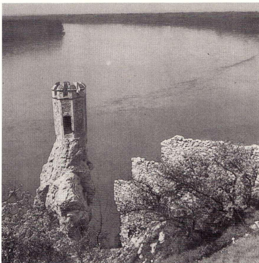
Devin, borg på en hög klippa vid sammanflödet av floderna Donau och Morava. Jungfrutornet.