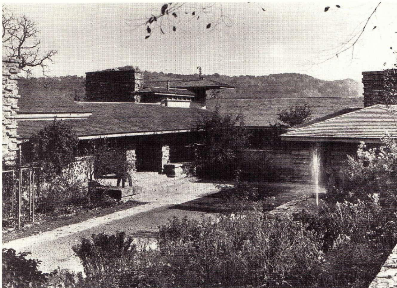
Frank Lloyd Wrights Taliesin, Spring Green, Wisconsin 1925.

bästa samhället och enskilda kan göra för varandra.