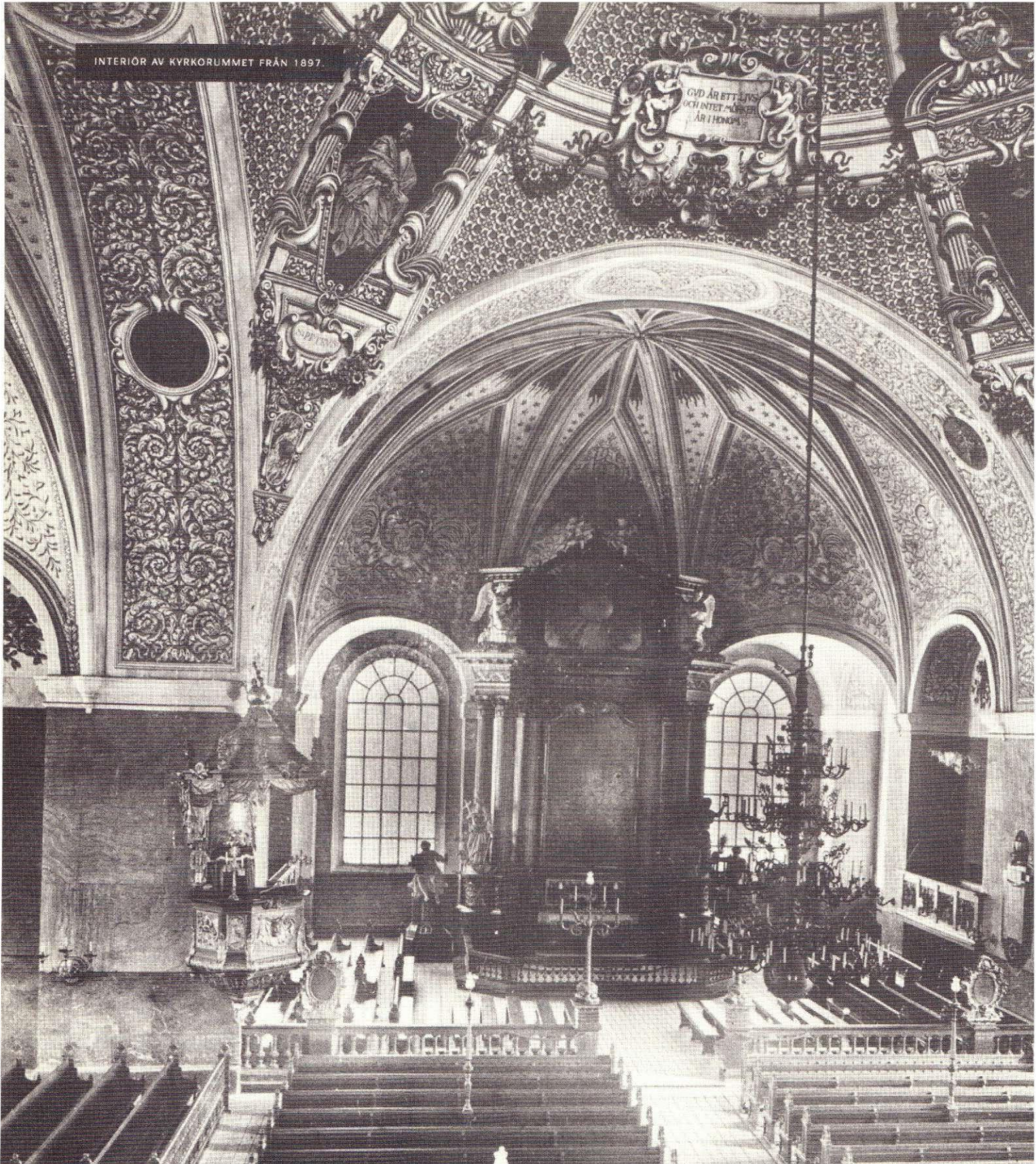
INTERIÖR AV KYRKORUMMET FRÅN 1897.