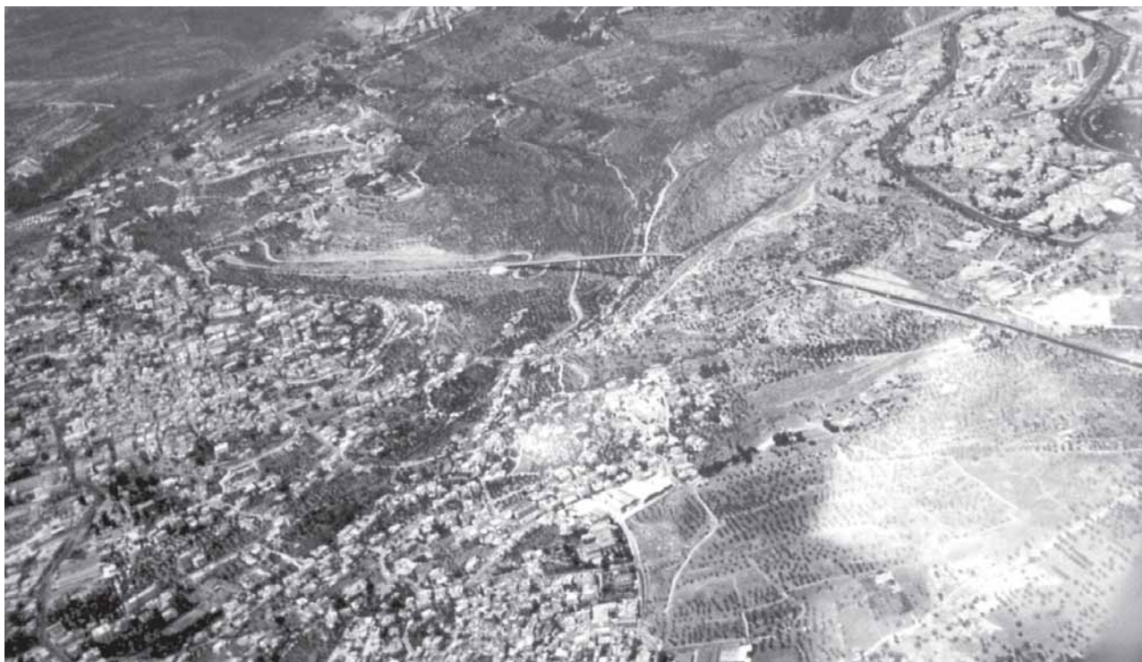
4. Infrastrukturen har ligesom bebyggelserne to forskellige, men dog parallelle, logikker på Vestbredden. (Franke, Anselm; Segal, Rafi & Weizman, Eyal) KW – institute for contemporary art, Berlin & Verlag der Buchhandlung Walter König, Köln, 2003.

inden de igen modificeres, forhandles eller inddrages. Ironisk nok bibeholder den multidimensionale kortlægning det abstrakte kortsentydige autoritet og bruges som argument for at føre en bestemt slags politik. Lidt pessimistisk kan man sige, at territoriet er blevet kortlagt i stykker, og at kort derfor er ubrugelige – vildledende – i dette terræn. Modsat kan det dog hævdes, at kortets brogede kompleksitet potentielt bidrager til at producere en rumforståelse, der med større nøjagtighed afspejler territoriets natur end den gamle, flade kartografi.