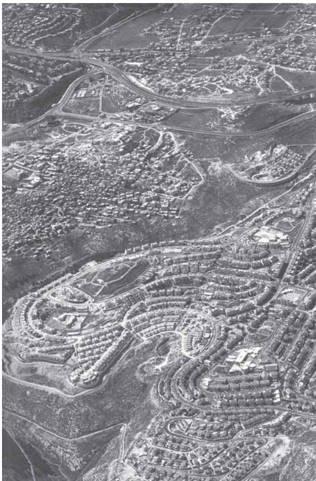
7. Billede af israelsk bosættelse lige ved siden af en palæstinensisk lejr i A Civilian Occupation (eds) Segal, Rafi & Weizman, Eyal, Babel & Verso, Tel Aviv & London, 2003.

boulevarder skulle forhindre civil ulydighed. I Jenin forvandlede gyder til alléer for at tanks kunne have manøvrerum, mens huse, elektricitet, kloakering mv. blev jævnet med jorden for at ødelægge beboernes muligheder for organisation og urban modernitet.