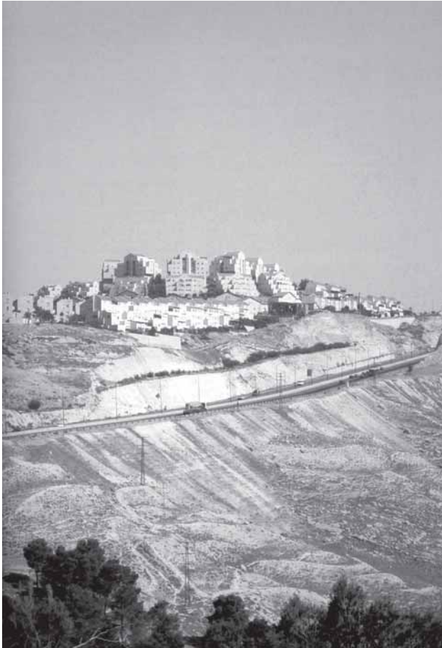
6. Bosættelse. (Franke, Anselm; Segal, Rafi & Weizman, Eyal) KW – institute for contemporary art, Berlin & Verlag der Buchhandlung Walter König, Köln, 2003.

frontlinier som tidligere nævnt bestandig produceres og forhandles.