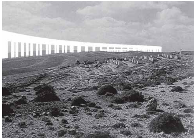
5. Billede af fiktive broer og infrastruktur (Franke, Anselm; Segal, Rafi & Weizman, Eyal) KW – institute for contemporary art, Berlin & Verlag der Buchhandlung Walter König, Köln, 2003.

Ved Camp David-forhandlingerne i juli 2000 udviklede daværende præsident Clinton et salomonisk forslag, der skulle give jøder og muslimer lige adgang til deres respektive helligdomme. Problemerne omkring det arabiske Østjeru-