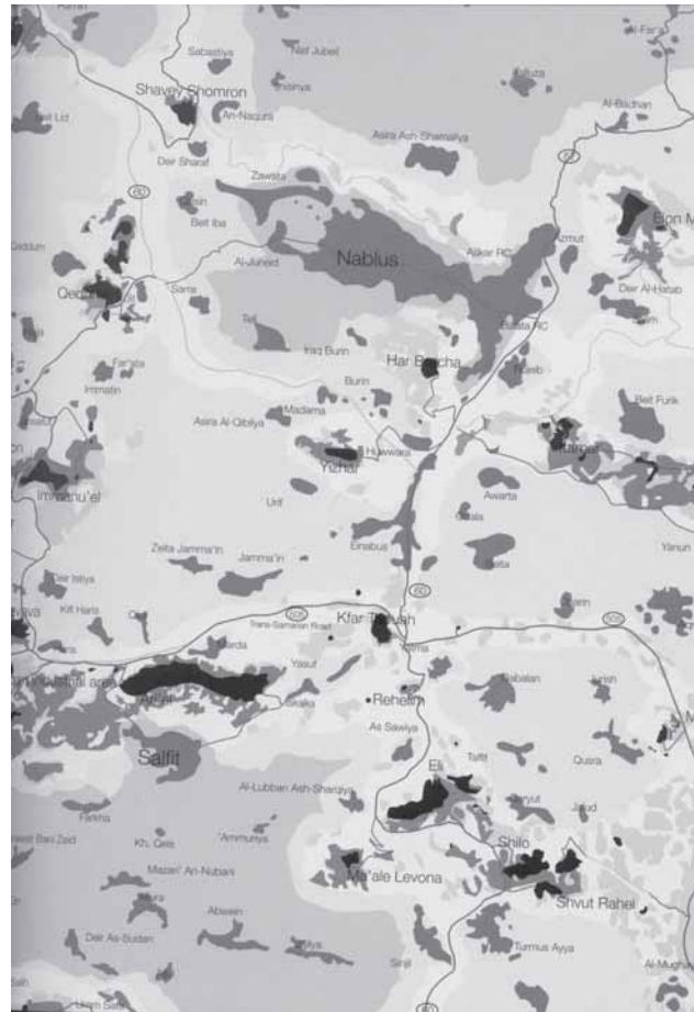
3. 'Camouflagekort' der viser forskellige kontrol-zoner på Vestbredden (Franke, Anselm; Segal, Rafi & Weizman, Eyal) KW – institute for contemporary art, Berlin & Verlag der Buchhandlung Walter König, Köln, 2003.

Normalt er geopolitik en flad diskurs, der ikke tager højde for vertikale dimensioner, men i den særlige israelsk-palæstinensiske geografi er diskursen udvidet til det tredimensio-