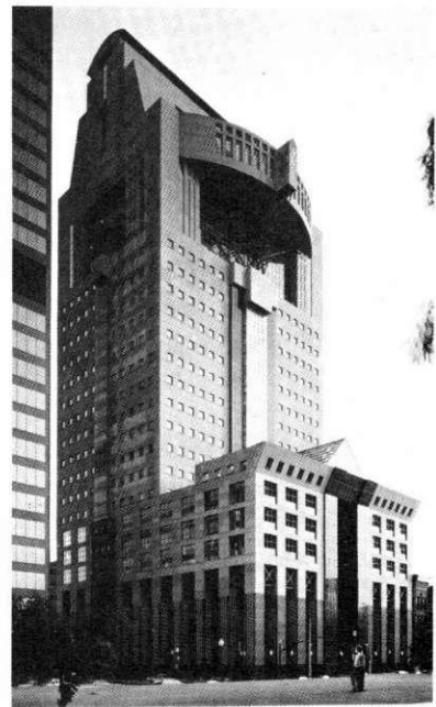
Humana Building, arkitekt Michael Graves. Ur ByggeKunst 6/86

Det kännetecknande för det genius loci han förespråkar blir då att en psykologisk identifikation och orientering bör eftersträvas genom att arkitekten uppövar en känslighet för