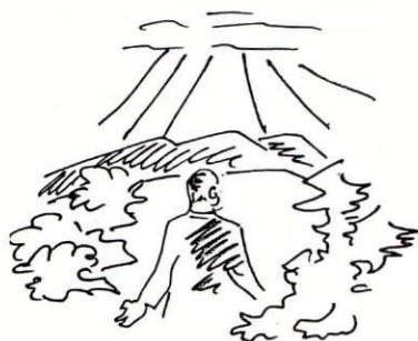
Illustration I: Enkla bilder kan visa enkla sammanhang på ett komplext sätt.