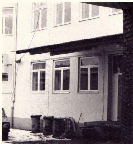
Flera fastigheter har trånga och svårtillgängliga lastplatser.

Ett annat företag som tillverkade lamparmaturer valde medvetet en lokalisering till Kungsten därför att där fanns de underleverantörer man behövde för smide, förnickling och lackering.