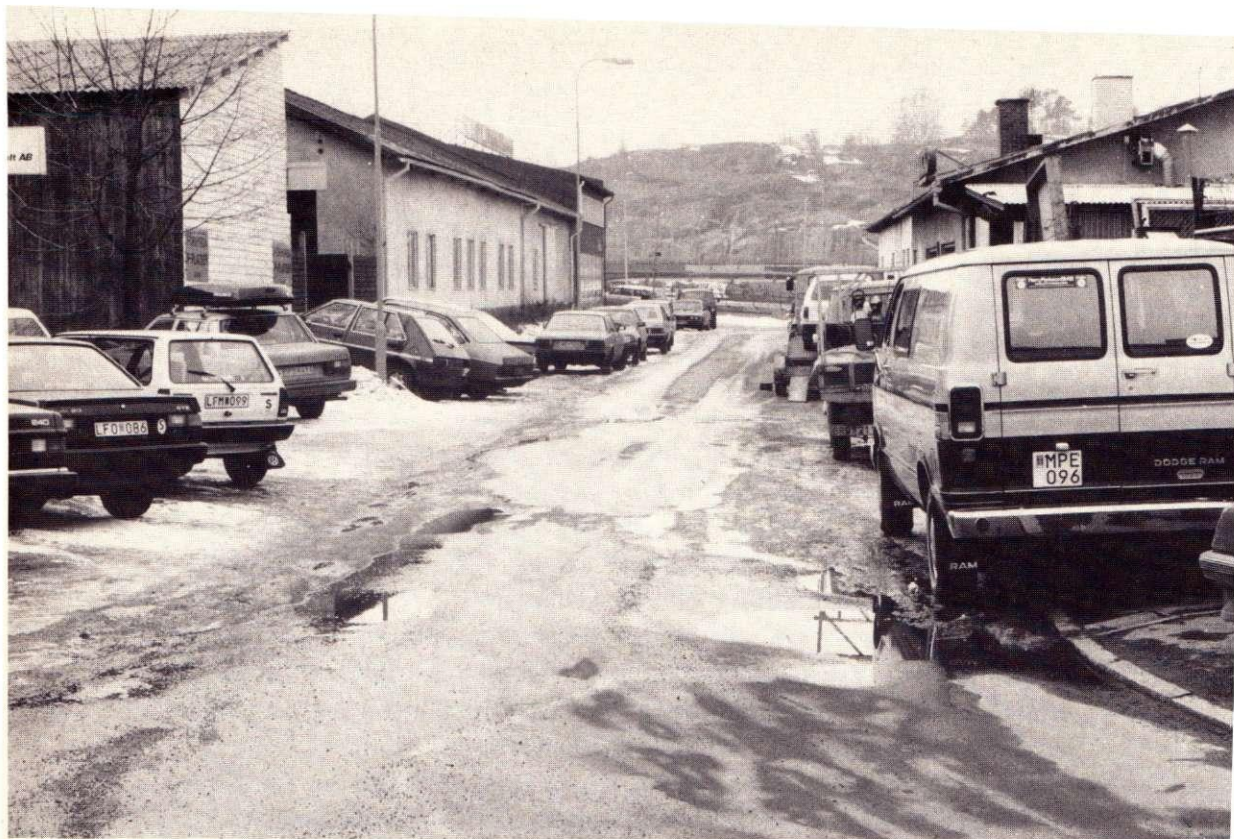
Trånga gator i dåligt skick och brist på parkeringsplatser var problem i Kungsten.

platser hyrde ut dessa. Senare iordningställdes större parkeringstomar på privat och kommunalägd mark.